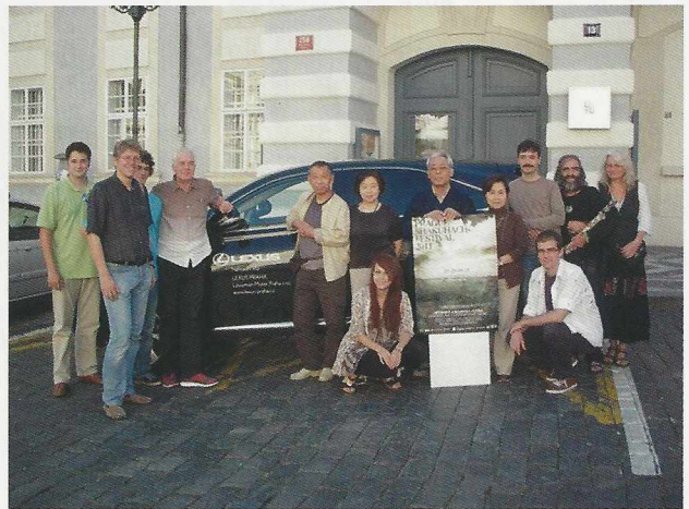
ブラハ音楽大学の前