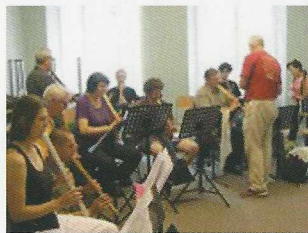
ブラハのワークショップ